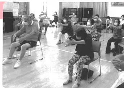
▲みなさんと一緒に軽体操

ーリング、健康体操、絵手紙、公園の除草など3密防止対策をしながら活動をしています。