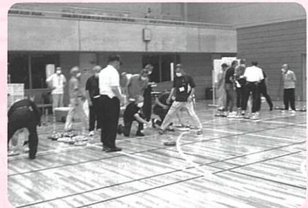
▲コロナ感染防止に配慮して実施しました

参加された方からは、「カローリングのルールが詳しく分かった」、「地域でもカローリングを広めたい」などの意見が聞かれました。